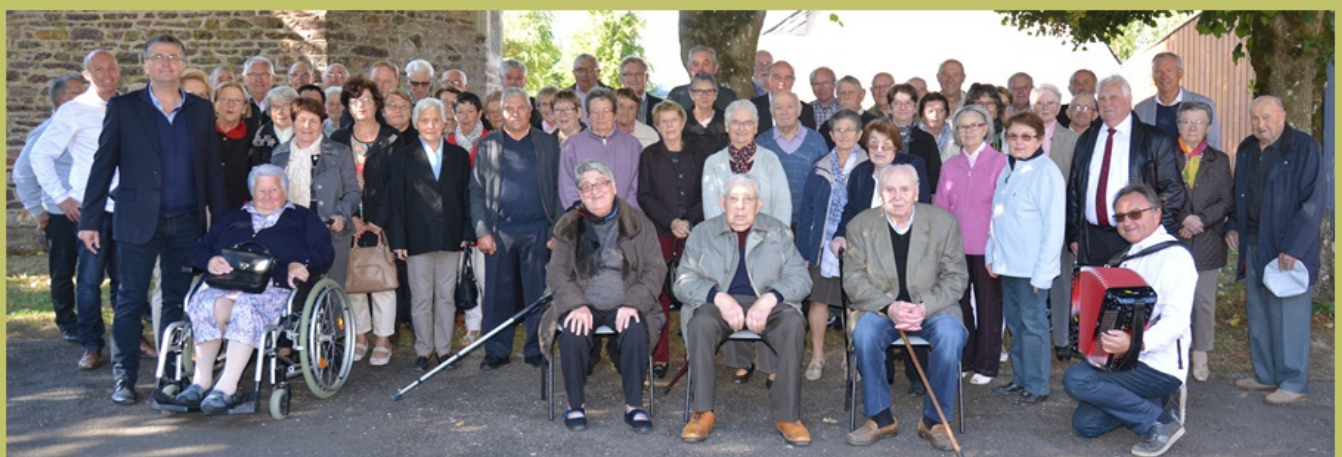
▲ soirée des associations 2 septembre 2016