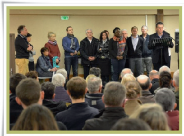
▲ cérémonie des vœux 7 janvier 2017