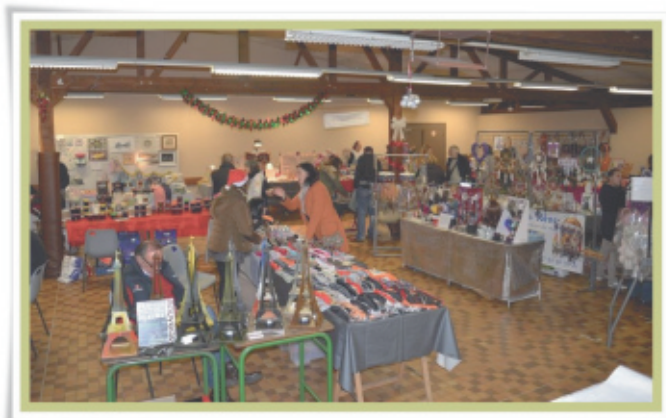
▲ marche de Noël 9 décembre 2016