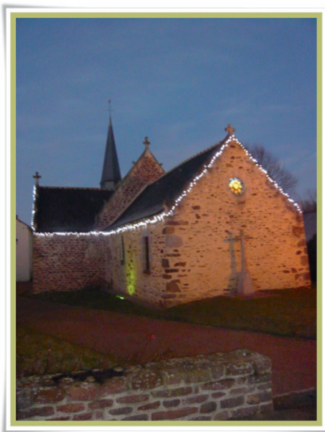
◀ église de Clayes illuminée décembre 2016