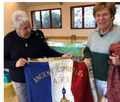
Merci aux couturières de Piq' et Coud pour la réparation d'un drapeau

Un dépôt de gerbes a été effectué par les anciens combattants, citoyens de la paix et élus municipaux.