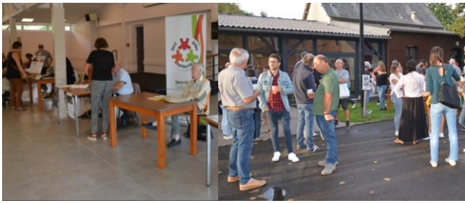
Soirée des associations Vendredi 8 septembre 2023