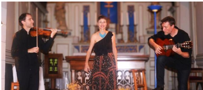
Concert Flamenco Lyrique des Valérianes Samedi 14 octobre 2023