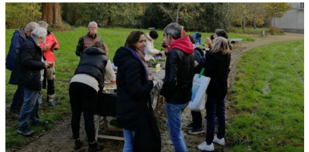
Bourse aux plantes de Terre de Clays Dimanche 19 novembre 2023