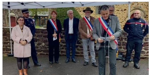
Fête de la Sainte-Barbe Samedi 9 décembre 2023