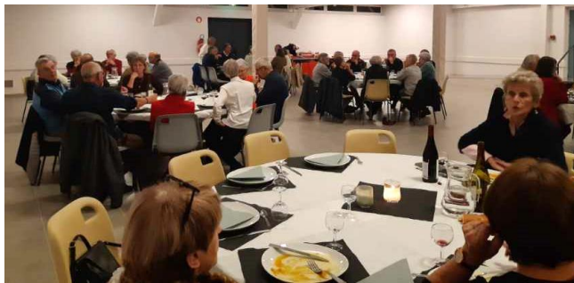
Soirée des bénévoles de l'épicerie sociale Vendredi 17 novembre 2023