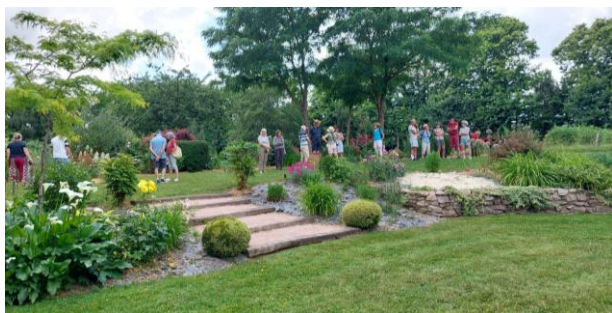
Bienvenue dans mon jardin Samedi 10 et Dimanche 11 juin 2023