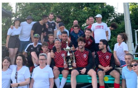
Tournoi de football du FC Clayes Dimanche 28 mai 2023