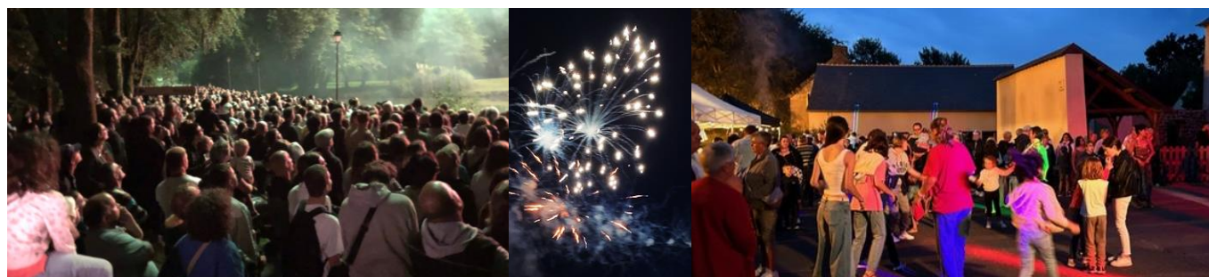
Feu d'artifice et Bal populaire Samedi 13 juillet 2023