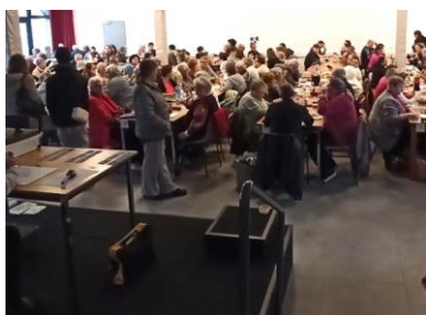
Loto de l'APE Mercredi 17 mai 2023