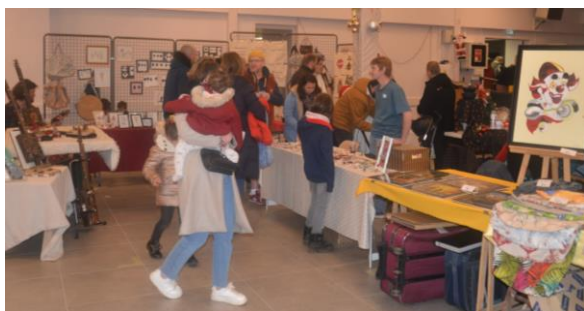
Marché de Noël Samedi 2 décembre 2023