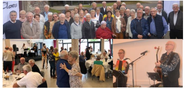
Repas des aînés Jeudi 12 octobre 2023