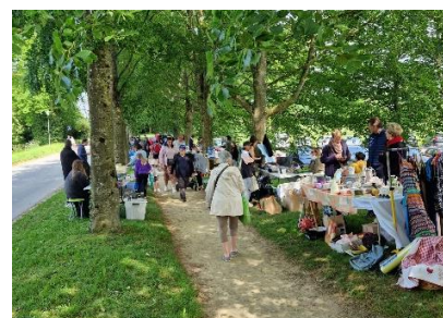
Braderie de l'APE Lundi 29 mai 2023