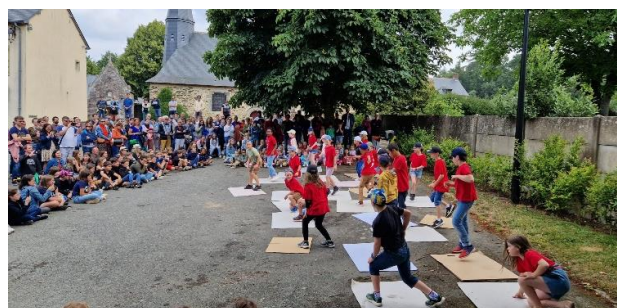
Fête de l'école Samedi 1 er juillet 2023