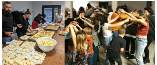
Soirée Tartiflette de l'APE Samedi 21 octobre 2023